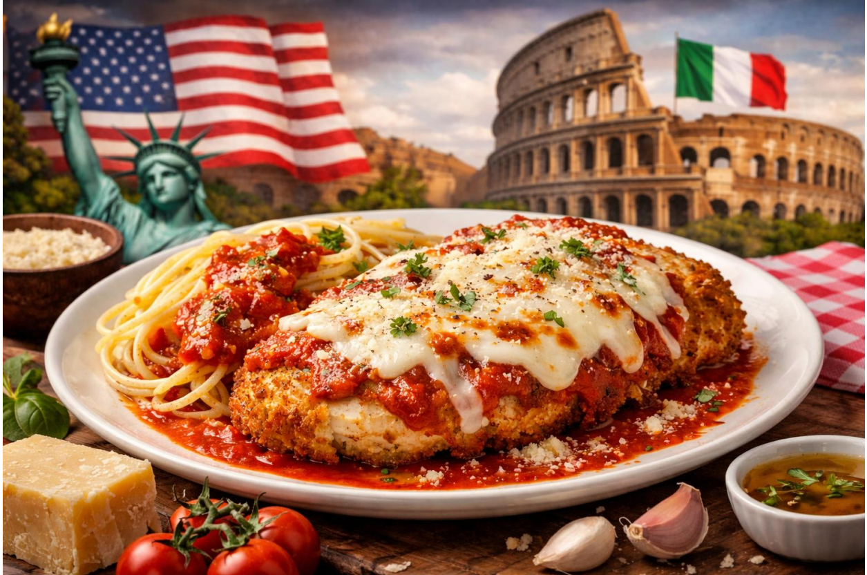
Foto 2 Chicken Parmesan