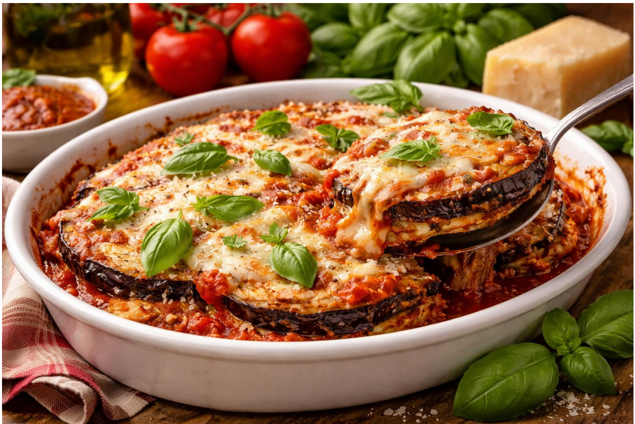
Foto 1 Parmigiana di Melanzane

Ma una volta arrivata in America, qualcosa cambiò.